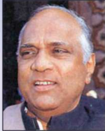
मा.ना. श्री. शरदचंद्रजी पवार कृषिमंत्री, भारत सरकार