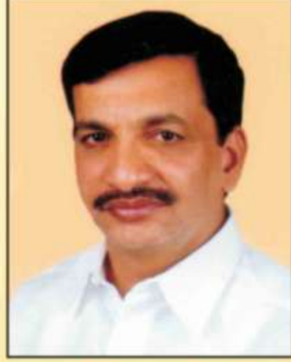
मा.ना. श्री. बाळासाहेब थोरात कृषिमंत्री, महाराष्ट्र राज्य तथा प्रतिकुलपती, डॉ. पं.दे.कृ.वि, अकोला