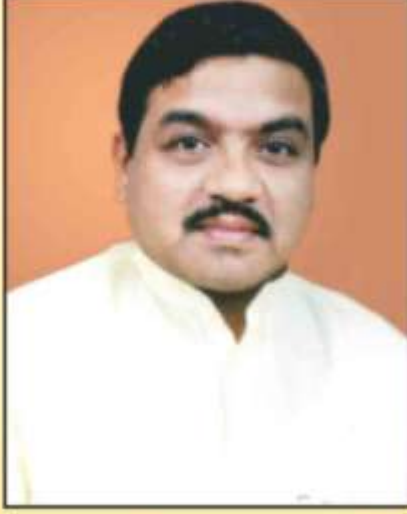
मा.ना. श्री. आर.आर. पाटील उपमुख्यमंत्री, महाराष्ट्र राज्य