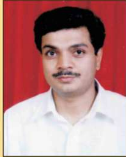
मा.ना. श्री. राणा जगजितसिंह पाटील कृषि राज्यमंत्री, महाराष्ट्र राज्य