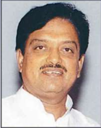
मा.ना. श्री. विलासरावजी देशमुख मुख्यमंत्री, महाराष्ट्र राज्य