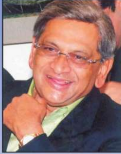
मा. श्री. एस.एम. कृष्णा राज्यपाल, महाराष्ट्र राज्य तथा कुलपती, डॉ. पं.दे.कृ.वि., अकोला